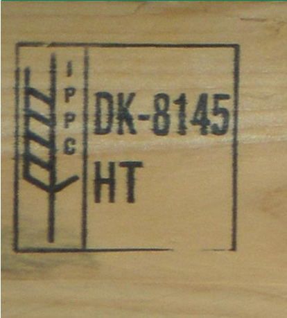
Fig. 1: Træemballage fra Danmark med ISPM-15 mærke