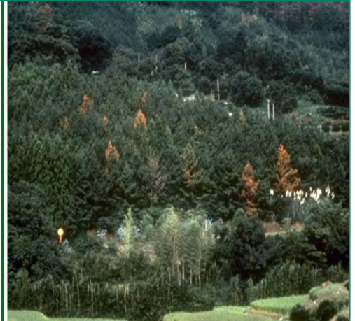
Fig. 3: Skov angrebet af fyrrevednematoden. Den spredes ofte til nye områder med træemballage