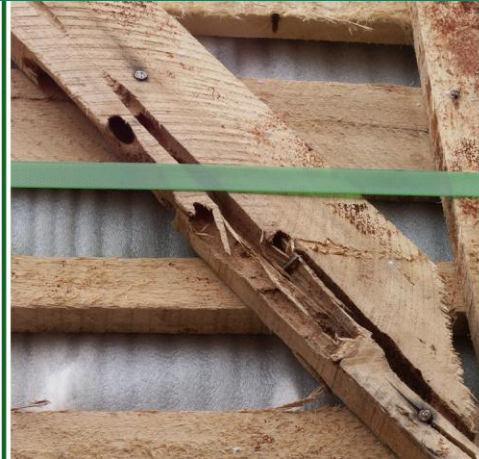
Fig. 2: Emballage med gallerier efter larver af asiatisk træbuk